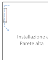
Installazione a Parete alta